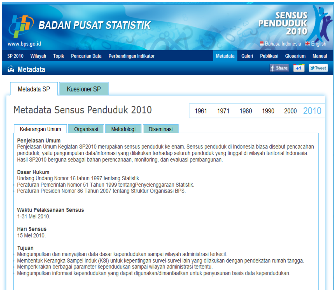
Gambar 8 Page Metadata Aplikasi Website Diseminasi Hasil SP2010