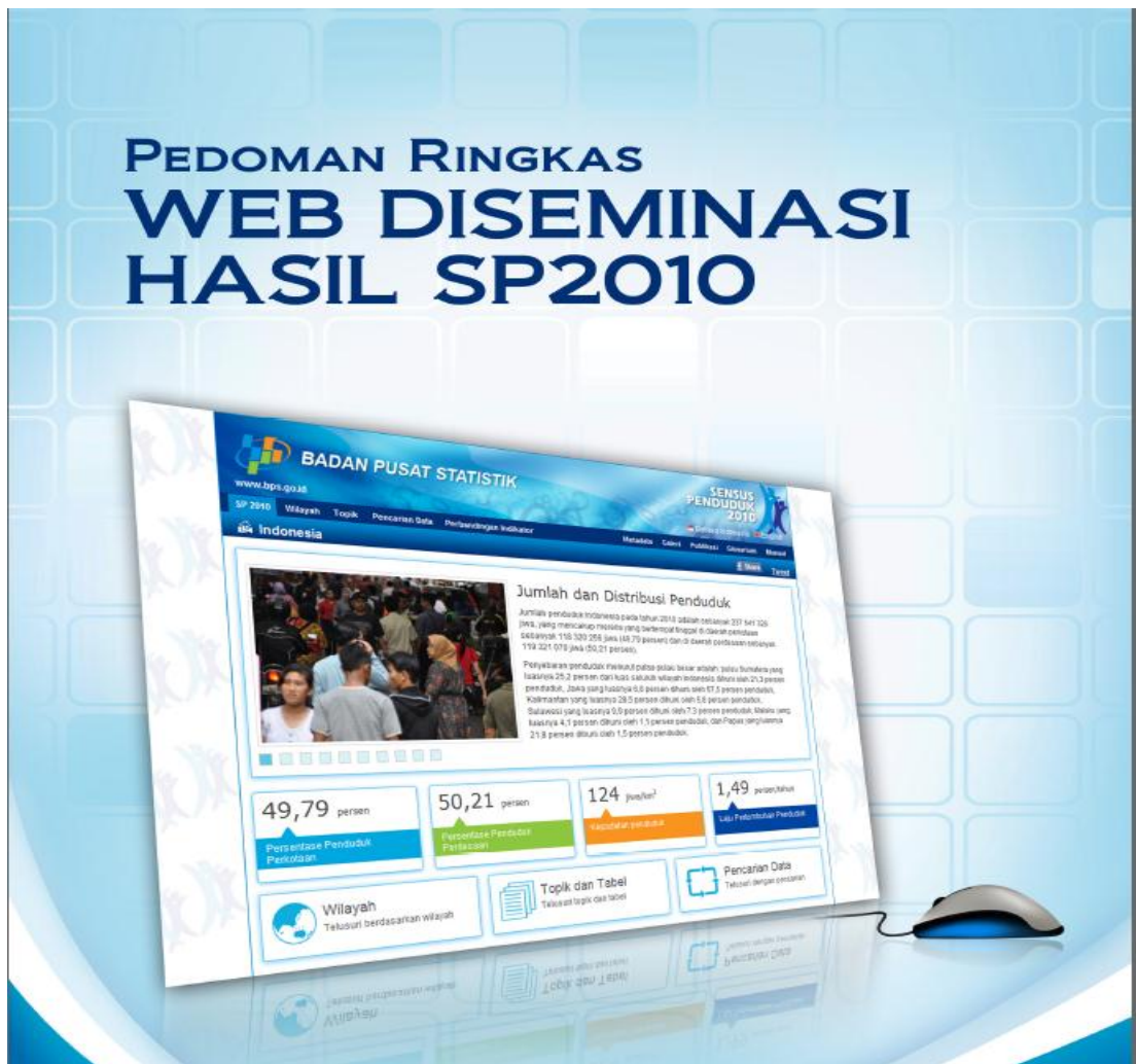
Gambar 12 Page Manual Aplikasi Website Diseminasi Hasil SP2010

Page ini merupakan page link ke file Pedoman Ringkas Web Diseminasi Hasil SP2010 yang berisikan penggunaan aplikasi dan content diseminasi Hasil SP2010.