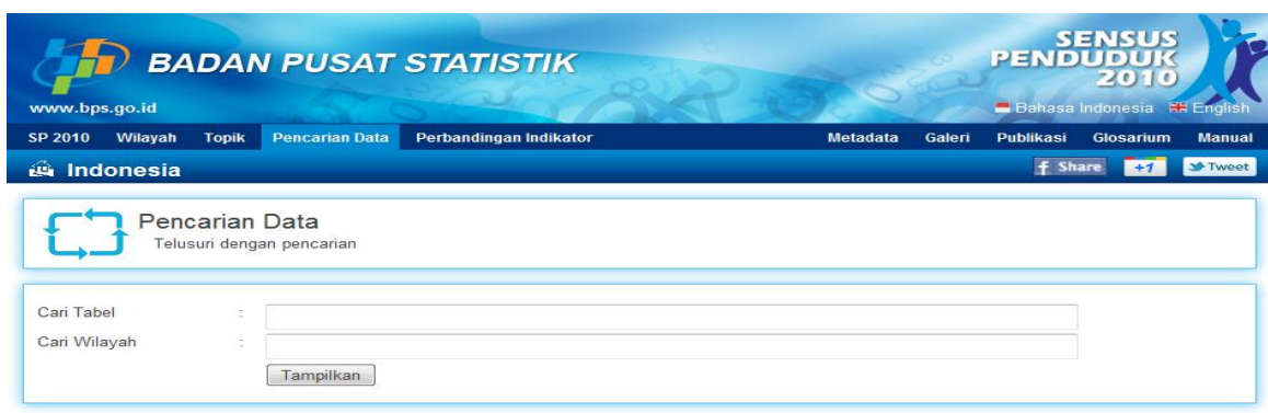
Gambar 6 Page Pencarian Data Aplikasi Website Diseminasi Hasil SP2010

Page Pencarian Data merupakan page keempat yang berfungsi untuk menelusuri data yang diinginkan. Penelusuran data terbatas hanya pada penelusuran judul tabel yang dibuat di dalam aplikasi ini, sehingga ketepatan judul tabel dengan data yang berada di dalam tabelnya menjadi sangat penting.