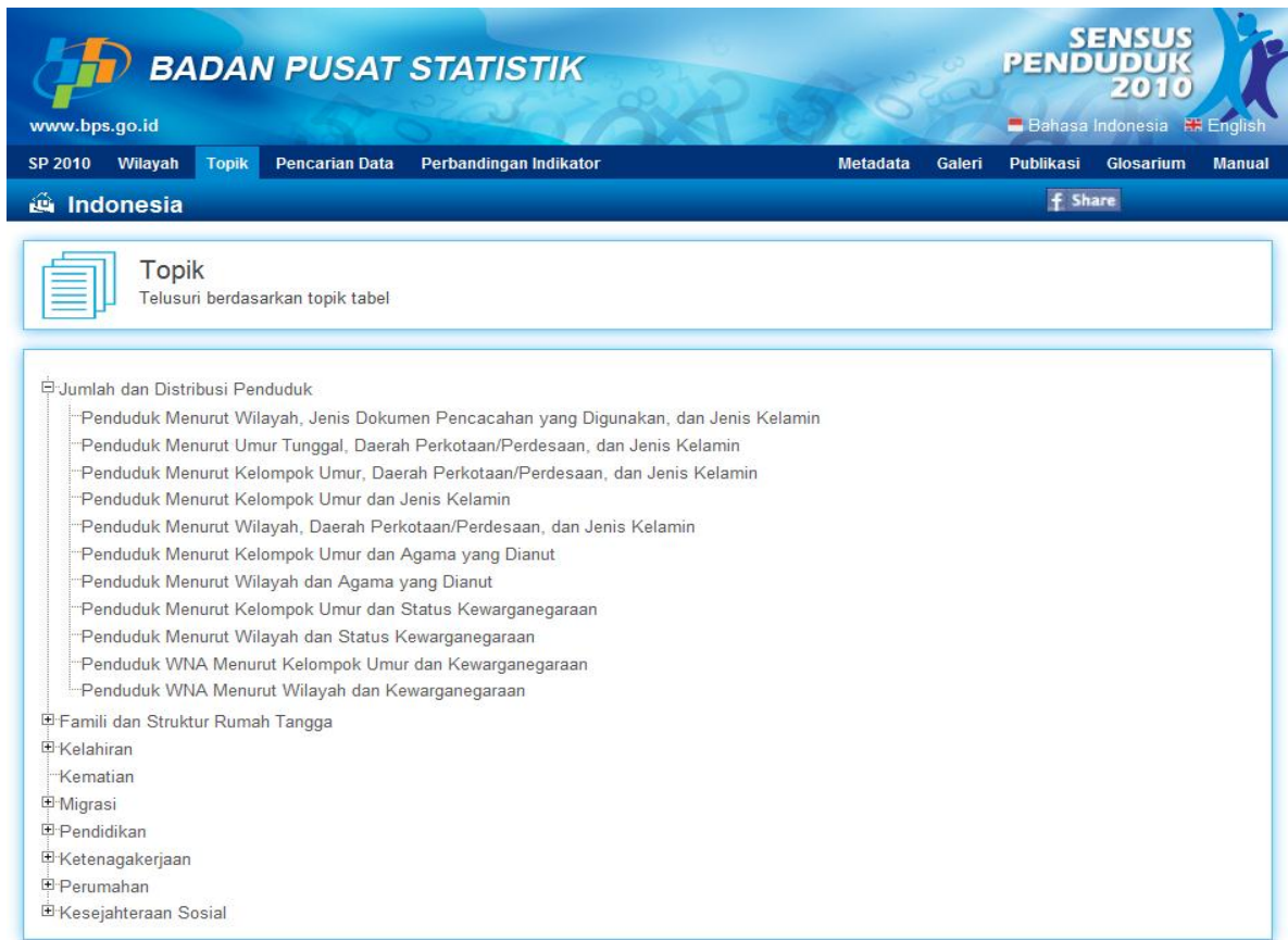
Gambar 5 Tabel pada Masing-Masing Topik di Page Topik Aplikasi Website Diseminasi Hasil SP2010