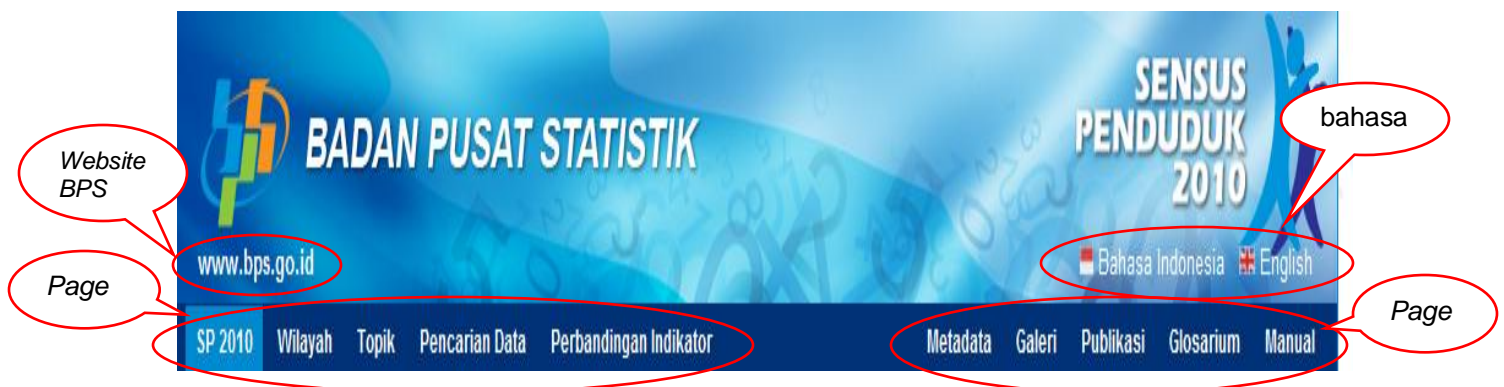
Gambar 1 Aplikasi Website Diseminasi Hasil SP2010

Page (halaman) aplikasi website diseminasi hasil SP2010 terdiri atas: (1) SP2010; (2) Wilayah; (3) Topik; (4) Pencarian Data; (5) Metadata; (6) Galeri; (7) Publikasi; dan (8) Glosarium. Selain itu, pada aplikasi ini juga dihubungkan ke website BPS RI yaitu www.bps.go.id , juga sebaliknya dari website BPS RI ke http://sp2010.bps.go.id , seperti terlihat pada gambar berikut: