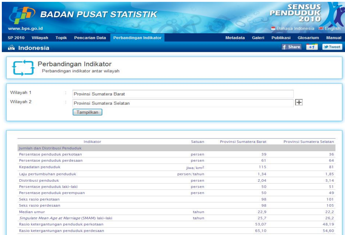
Gambar 7 Page Perbandingan Indikator Aplikasi Website Diseminasi Hasil SP2010

Page Perbandingan indikator merupakan page untuk melihat keterbandingan satu atau lebih indikator di suatu wilayah terhadap wilayah lainnya. Page ini sangat bermanfaat untuk pijakan arah kebijakan pemerintah khususnya pemerintah daerah baik pemerintah provinsi maupun kabupaten/kota.